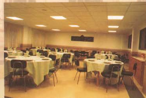
Cocina y comedor para 70 personas