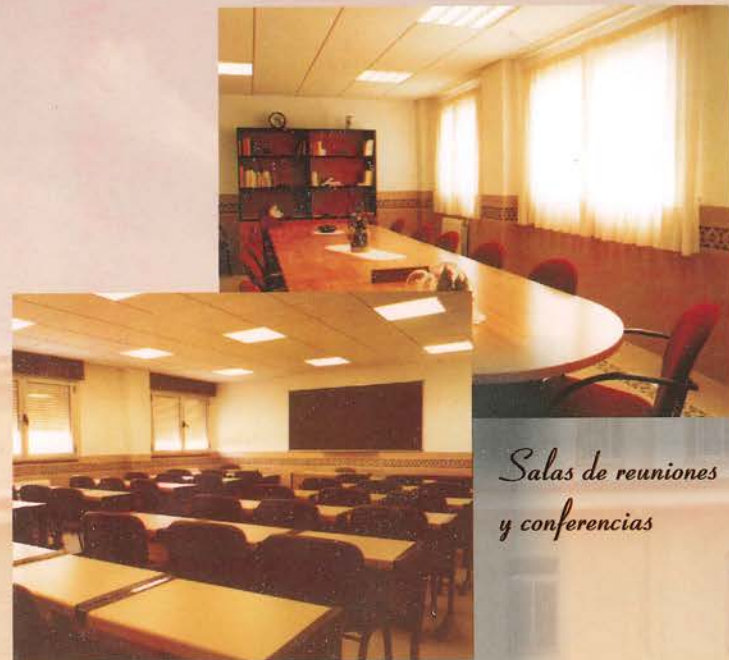
Salas de reuniones y conferencias