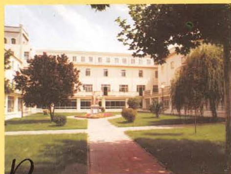
Paseos y jardines

En Parmenia, pequeña localidad al sureste de Francia, en medio de un entorno paradisíaco, Juan de La Salle se retiró pensando que era un obstáculo para la obra que Dios le había confiado.