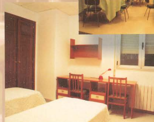
30 habitaciones individuales y dobles con baño